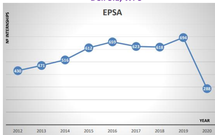
Graf 1. - Jumlah Latihan Industri Setiap Tahun di EPSA

Jumlah syarikat yang menjadi hos latihan industri yang menggunakan kerangka program ini: Antara 240 hingga 320 syarikat setiap tahun sejak tahun 2012. *Data dikemas kini sehingga 22/07/2020.