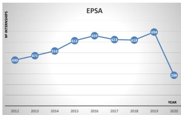
Grafik 1. – Jumlah magang per-tahun di EPSA

Jumlah perusahaan yang menerima peserta magang dalam kerangka kerja program ini: Antara 240 dan 320 perusahaan setiap tahun sejak 2012. *Data terbaru hingga 22/07/2020